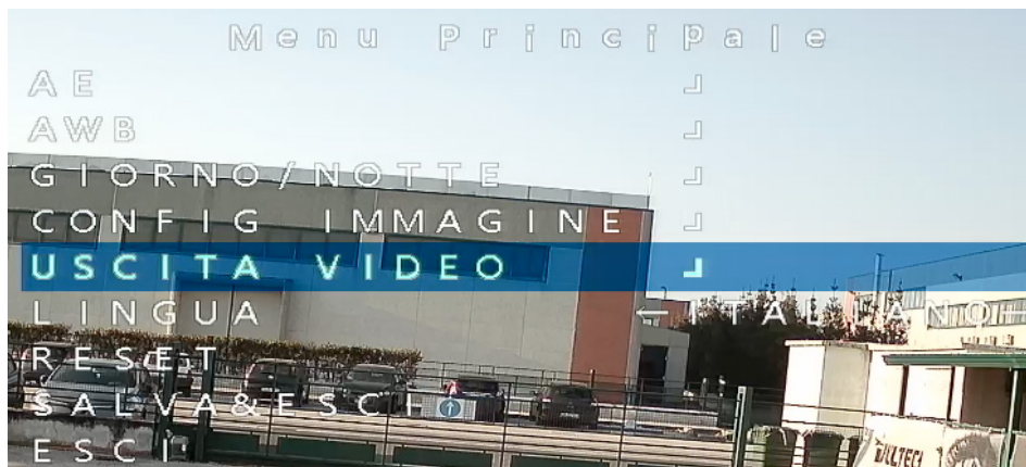
Figura 1 – Menù OSD telecamera VS-UVC4000 Series