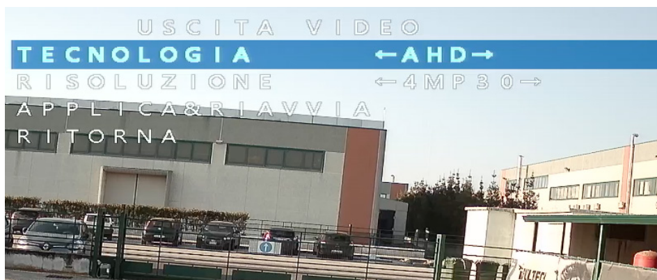
Figura 2 – Selezione tecnologia e risoluzione video